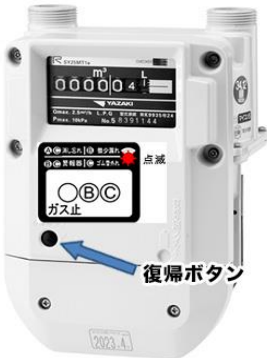
S型マイコンメーター