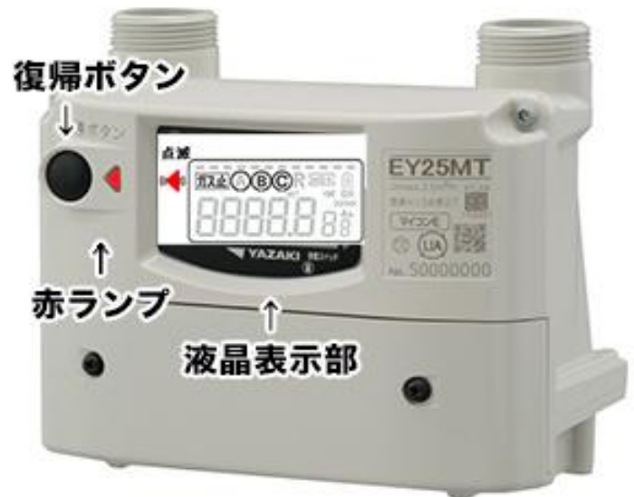
E型マイコンメーター